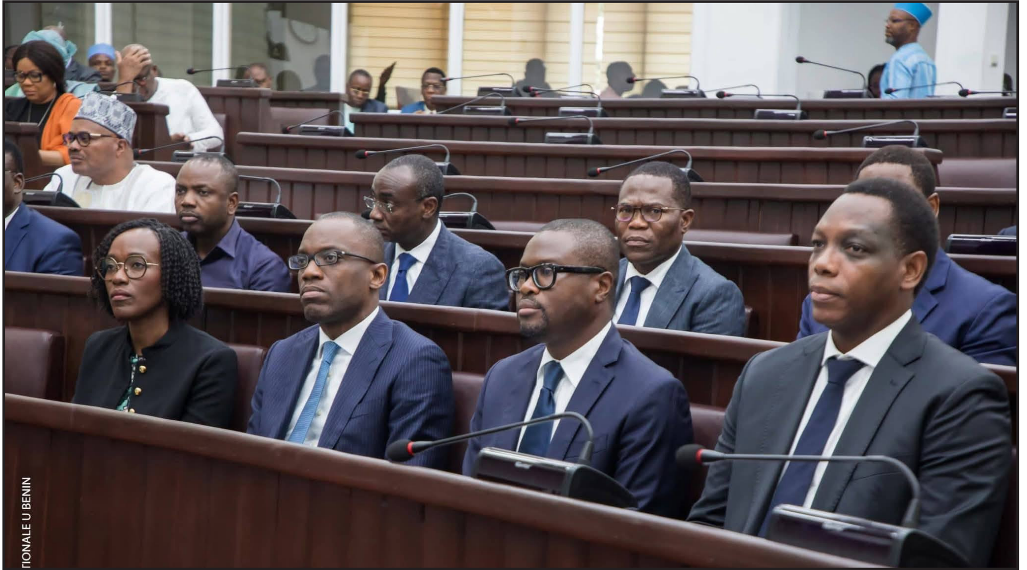
TONALE U BENIN

Ce jeudi 4 décembre 2025, l'Assemblée nationale a voté en séance plénière la loi de finances pour la gestion 2026. Les députés, réunis au Palais des Gouverneurs à Porto-Novo, ont adopté à l'unanimité le budget général de l'État, arrêté à 3 783,984 milliards de francs CFA, en hausse de 6,6 % par rapport aux 3 551,01 milliards de 2025.